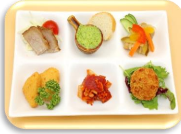
オードブルプレート