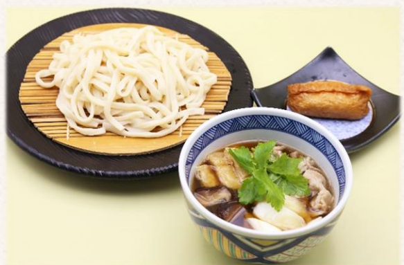
武蔵野うどん (いなり付)