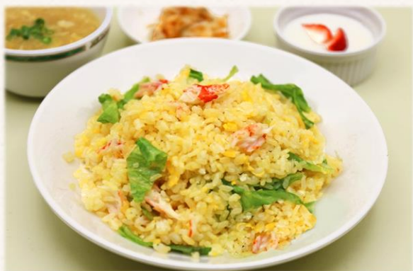
上海蟹味噌入り 蟹とレタスのチャーハン