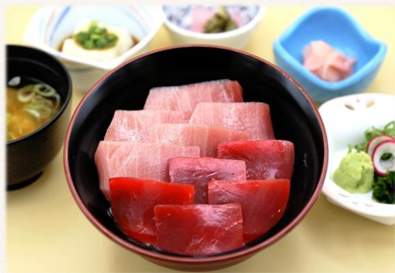
本まぐろ丼 (赤身、中トロ)