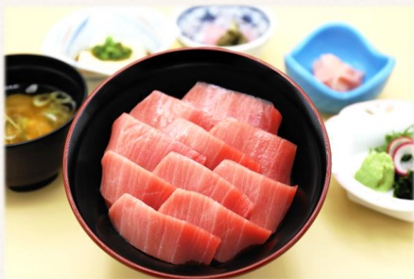
特上 本まぐろ丼 極み (中トロ)