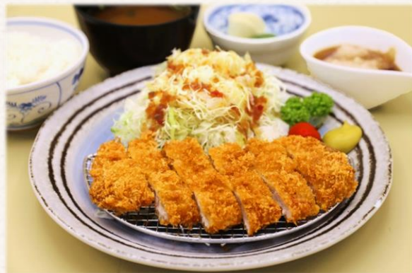
ロースカツ定食 (八幡平ポーク) ¥1,760 (税抜価格¥1,600)