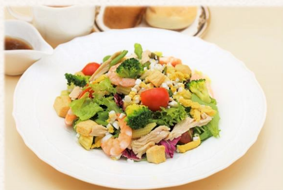
サラダランチ (シーザー又は和風ノンオイル) ¥1,540 (税抜価格¥1,400)