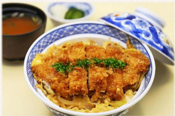
かつ丼 (八幡平ポーク) ¥1,760 (税抜価格¥1,600)