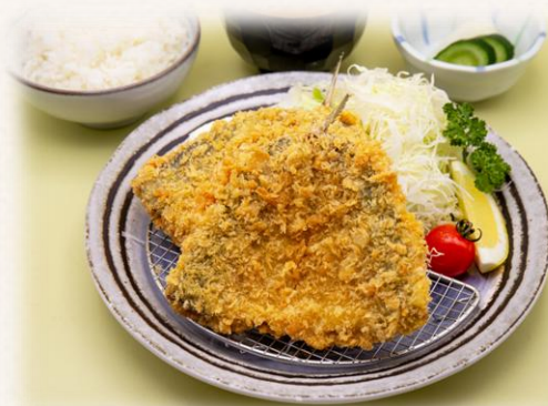
アジフライ定食 ¥1,760 (税抜価格¥1,600) 839kcal