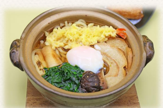
鍋焼きうどん ¥1,760 (税抜価格¥1,600) 532kcal