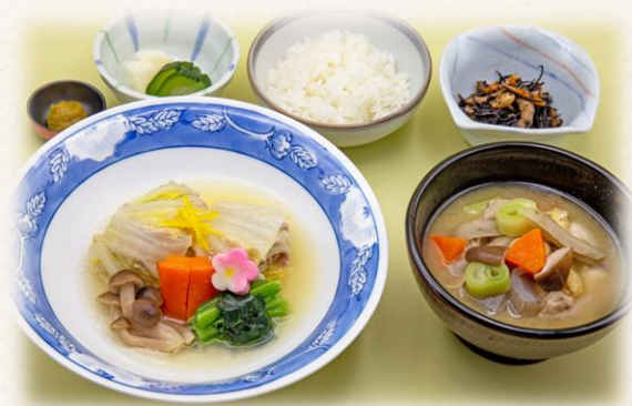
豚と白菜の重ね蒸し ¥1,760 (税抜価格¥1,600) 638kcal