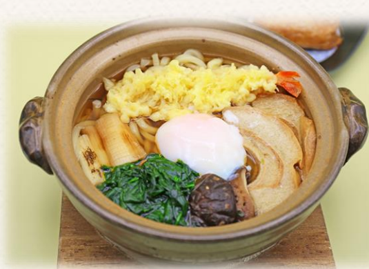
鍋焼きうどん ¥1,760 (税抜価格¥1,600) 532kcal