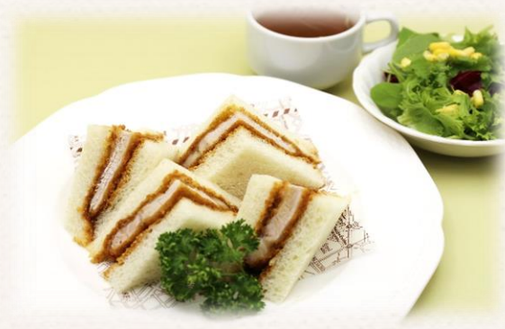
カツサンド(八幡平ポーク) ¥1,540 (税抜価格¥1,400) 784kcal