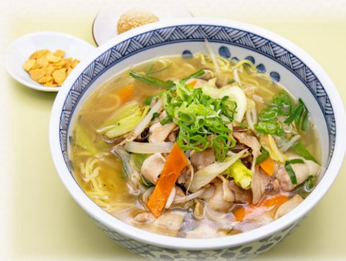
スタミナタンメン ¥1,760 (税抜価格¥1,600) 873kcal