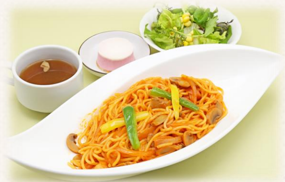
ナポリタン ¥1,760 (税抜価格¥1,600) 740kcal