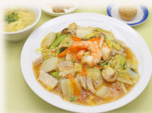
五目あんかけ焼きそば ¥1,760 (税抜価格¥1,600) 777kcal