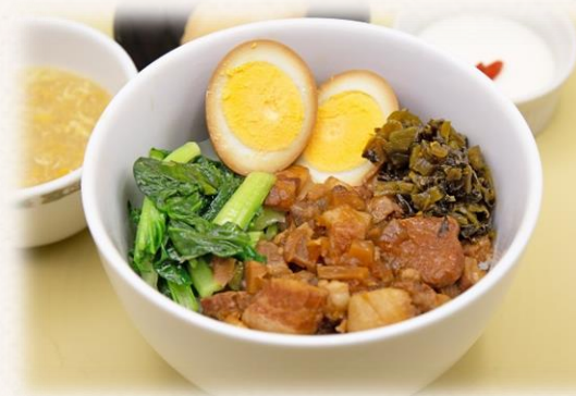
ルーロー飯【豚肉の香味煮かけご飯】 ¥1,760 (税抜価格¥1,600) 964kcal