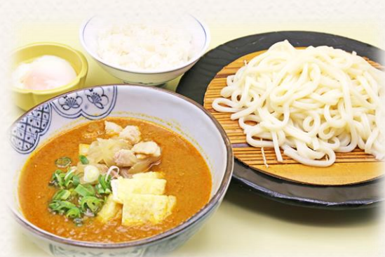
カレーつけうどん ¥1,760 (税抜価格¥1,600) 907kcal