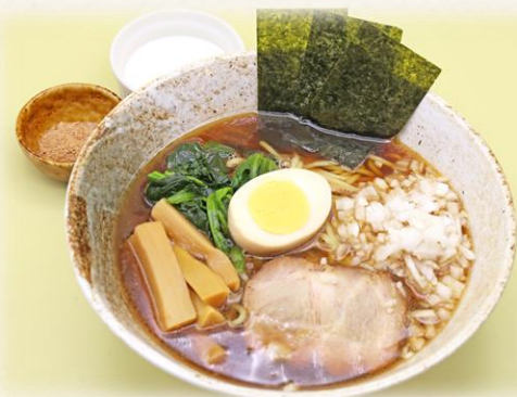
醤油ラーメン(淡路島産玉ねぎ入り) ¥1,760 (税抜価格¥1,600) 873kcal

※中華丼またはかた焼きそばもご用意できます。 ミックスサンド(卵&チーズハム) ¥1,100もご用意できます。