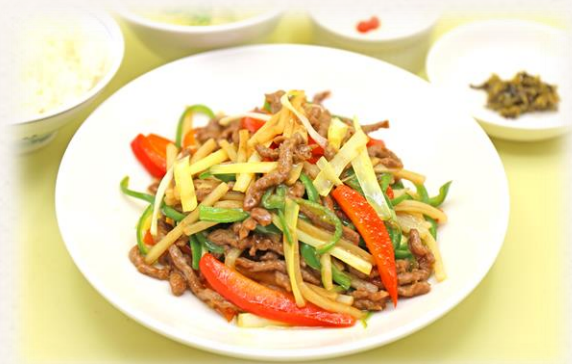
チンジャオロース定食 ¥1,760 (税抜価格¥1,600) 769kcal