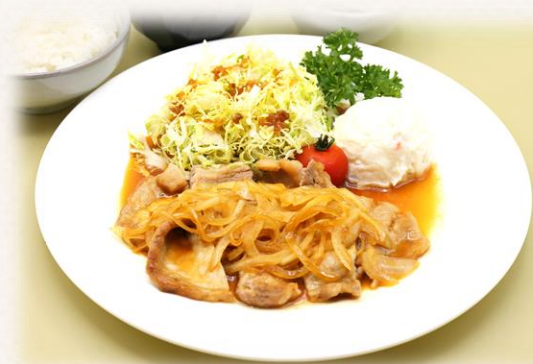
生姜焼き定食 ¥1,760 (税抜価格¥1,600) 864kcal