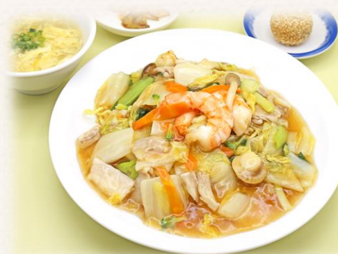
五目あんかけ焼きそば ¥1,760 (税抜価格¥1,600) 777kcal