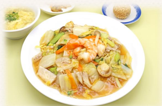
五目あんかけ焼きそば ¥1,760 (税抜価格¥1,600) 777kcal