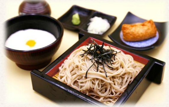
とろろそば・うどん ¥1,760 (税抜価格¥1,600) 627・662 kcal