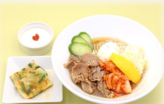
冷麺 ¥1,760 (税抜価格¥1,600) 680kcal

※中華丼またはかた焼きそばもご用意できます。 ミックスサンド(卵&チーズハム) ¥1,100もご用意できます。